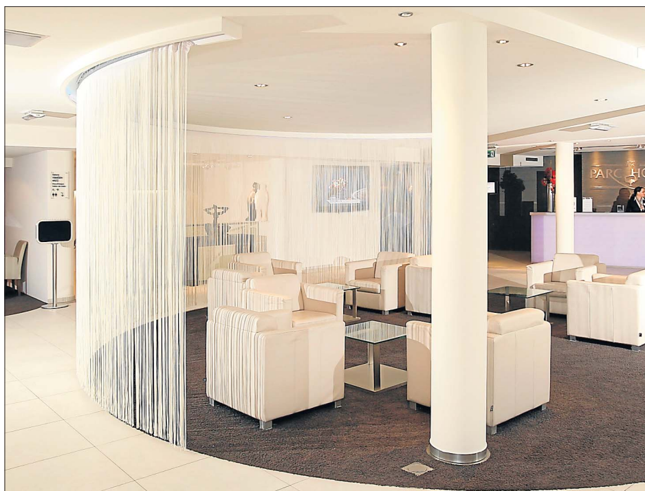
Un agréable lounge: pour attendre un rendez-vous, un taxi...

Cure de jouvence complète pour l'un des plus grands hôtels luxembourgeois