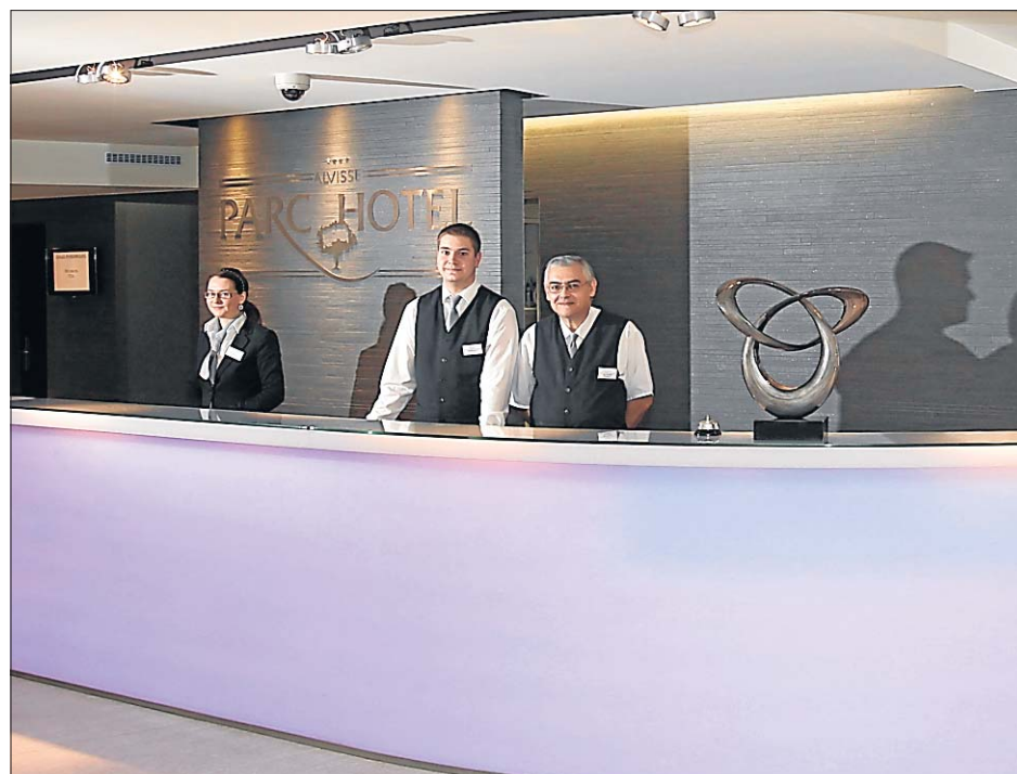
La réception de l'hôtel: une équipe souriante et très professionnelle.

PAR ANNE FOURNEY (TEXTE)