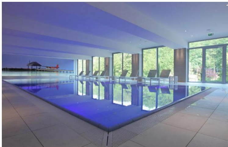
La magnifique piscine avec vue sur la nature.

tionnel, on y trouve une salle de sport équipée de machines de fitness ultra modernes telles que banc de musculation, vélos, tapis de course, rameur... Une pièce agréable avec de grandes ouvertures sur la nature. La nature... Elle est présente partout autour des bâtiments: fleurs, gazon, arbustes, forêt... C'est ce qui plaît aux clients de l'hôtel Alvisse: cette végétation qui abonde aux proches alentours; la possibilité de se promener à pied ou à vélo dans la forêt, d'aller faire son jogging tranquillement. Tout cela à deux pas du centre-ville, du Kirchberg et des axes rou-